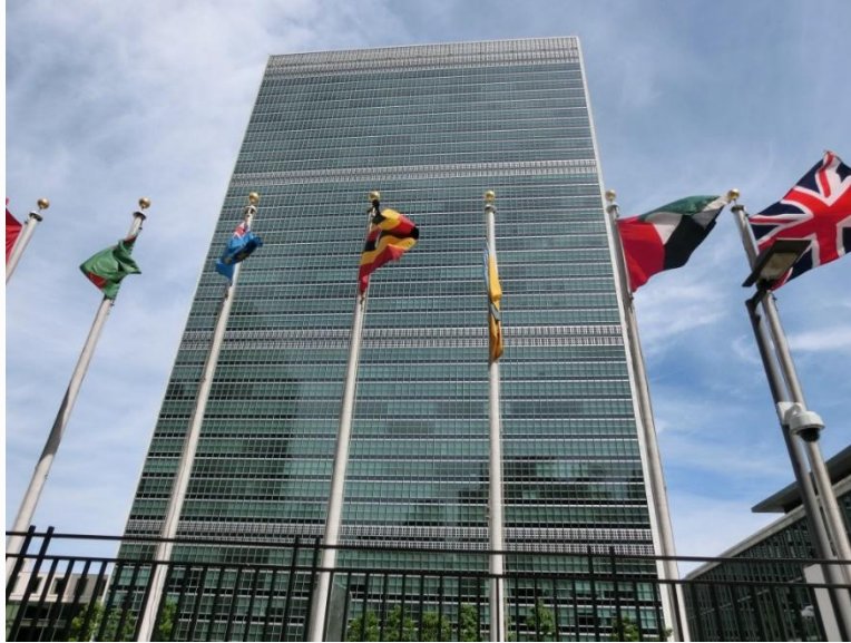
Trụ sở Liên Hiệp Quốc tại New York, USA